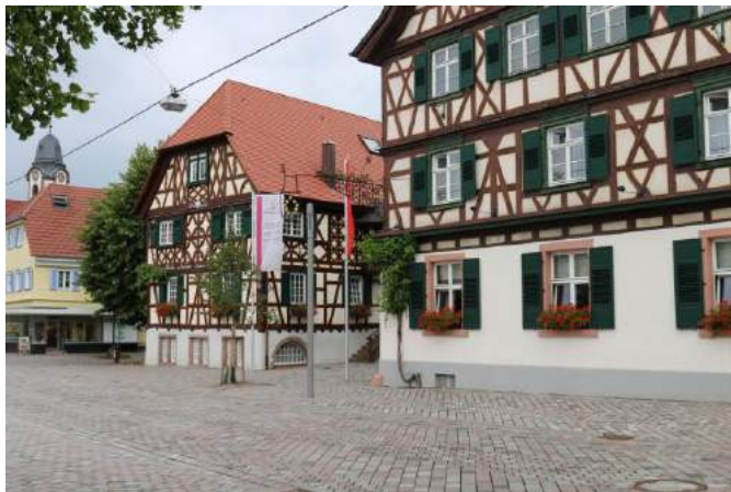
Hotel Obere Linde mit der verkehrsberuhigten Hauptstraße.

Oberkirch ist ein idyllisches Städtchen im Renchtal. Günstig gelegen an der B 28 (Straßburg-Freudenstadt). Berühmter Weinort; großer Obst- und Erdbeermarkt. Auf der heutigen Burgruine Schauenburg wirkte der größte deutsche Barockdichter Hans Jakob Christoffel von Grimmelshausen als Burgverwalter; als Wirt des „Silbernen Sterns“ im Ortsteil Gaisbach schrieb er an seinem „Simplicius Simplicissimus“.